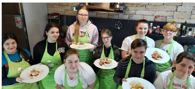
Kurz za podpory NROS Restaurační moučníky