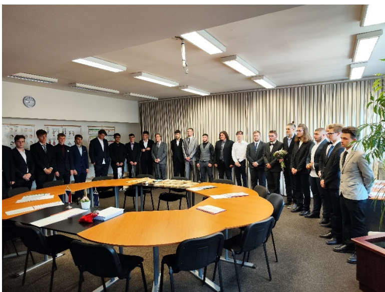
Ústní ZZ oboru Truhlář