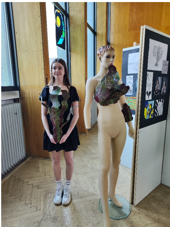
Obhajoby klauzurních prací M1