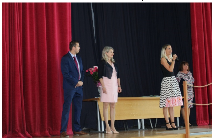
Předávání maturitních vysvědčení