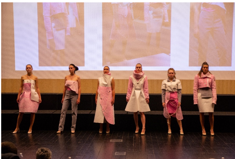
Soutěž Oděv a textil Liberec