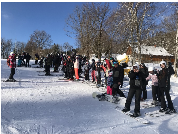
Lyžařský kurz Herlíkovice