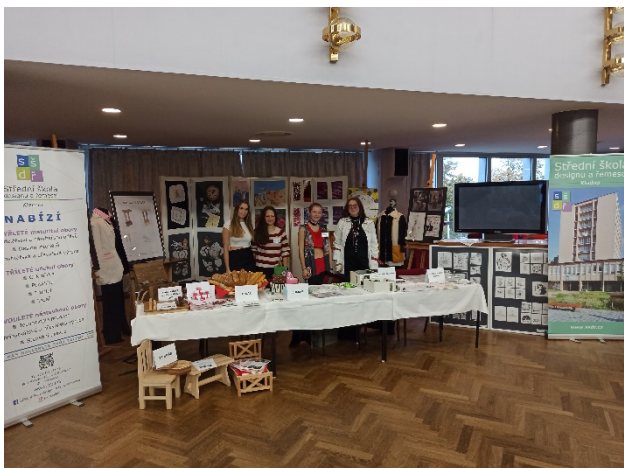
Stánek na Veletrhu vzdělávání Kladno