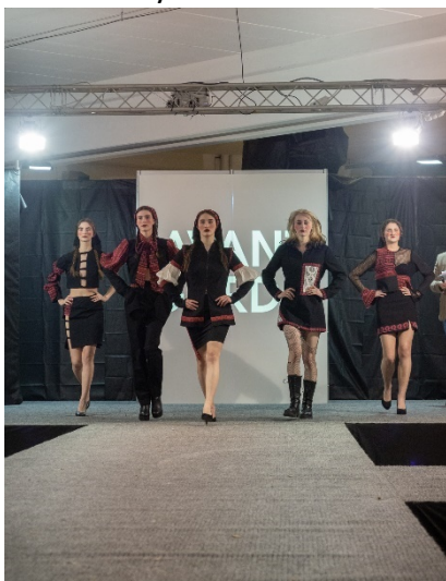
Soutěž Avantgarda 23 Lysá n. Labem