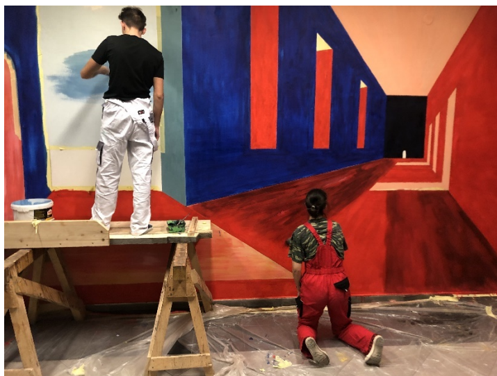
Tvorba nástěnné malby ve foyer školy