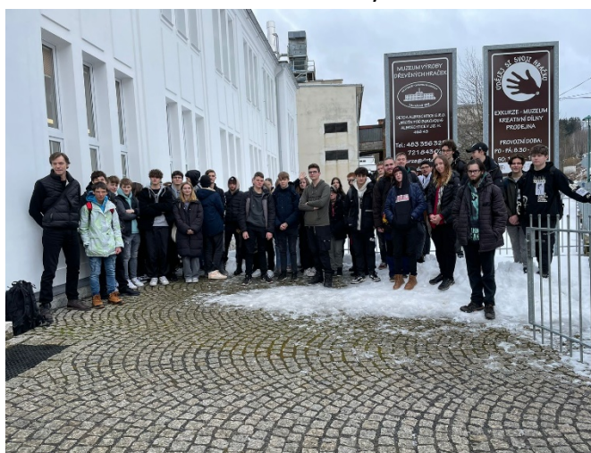
Exkurze truhlářů do firmy Detoa