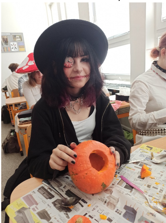
Halloween a dlabání dýní