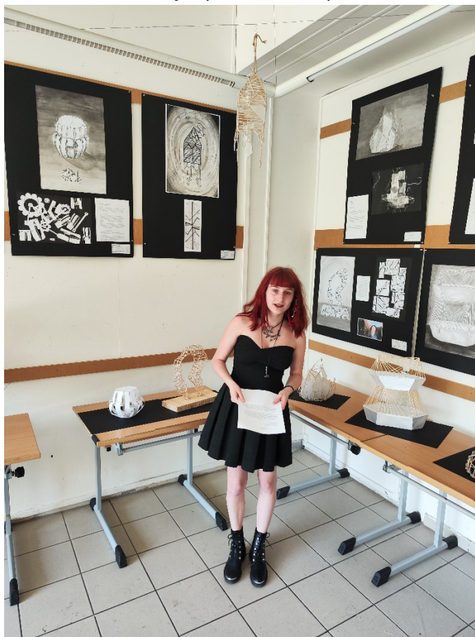
Obhajoby klauzurních prací Di1