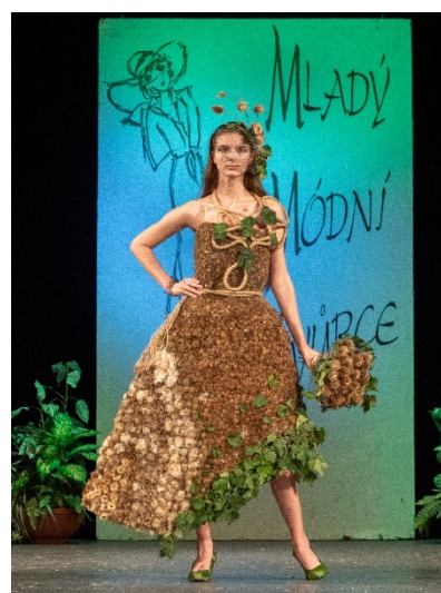
Soutěž Mladý módní tvůrce Jihlava