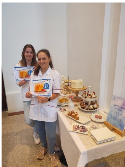
Soutěž Karmelské slavnosti cukráři