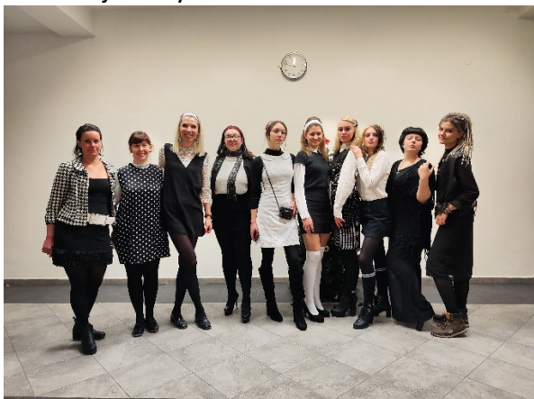
Projektový den 60. léta Black & White